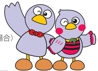
埼玉県のマスコット コバトン&さいたまっちゃん

消費者ホットライン ☎188（いやや！）※全国共通3桁番号で最寄り消費生活支援センター又は国民生活センターにつながります。