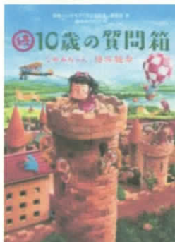
こどものしつものに 44人の作家が答えます