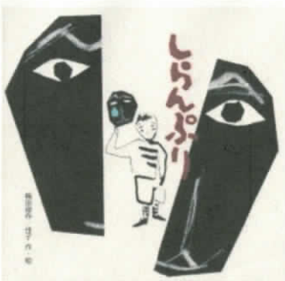
10・11月はいじめぼうし月間です。 いじめについて 考えてみましょう。