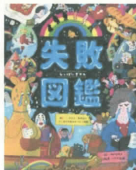
失敗エピソードを 集めた1さつ!!