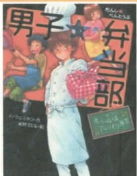
男子弁当部をつかった 3人の男子のお話