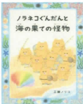
ノラネコ軍団の 冒険物語