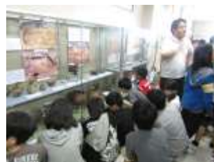
<二小学区から出土した文化財>