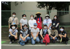
【美化活動、ありがとう】

4年1組の今学期の振り返りからは、友達と関わり合いながら楽しく学校生活が過ごせた様子がうかがえます。集団生活を過ごす中には、毎日が楽しいことばかりでなく、きっと辛かったことや苦し